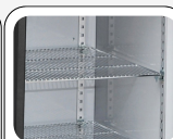
Étagères réglables en chrome