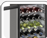
Étagères à vin disponibles en option