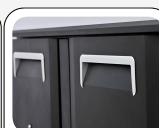
Poignée de porte en mousse